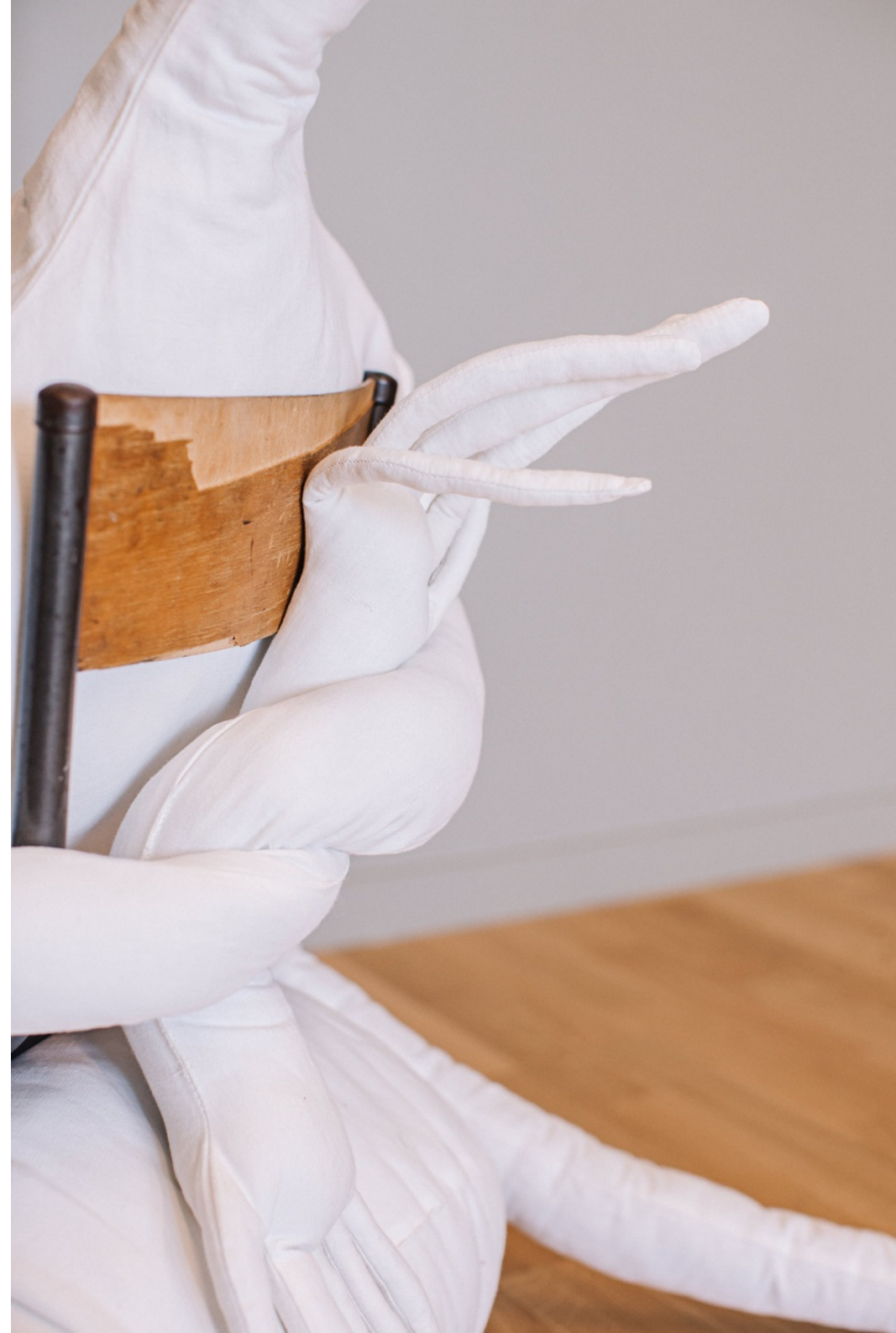
Constance Boulay, Prière , 2023, Chaise, drap de lin, couture, ouate, 110 x 130 x 13 cm