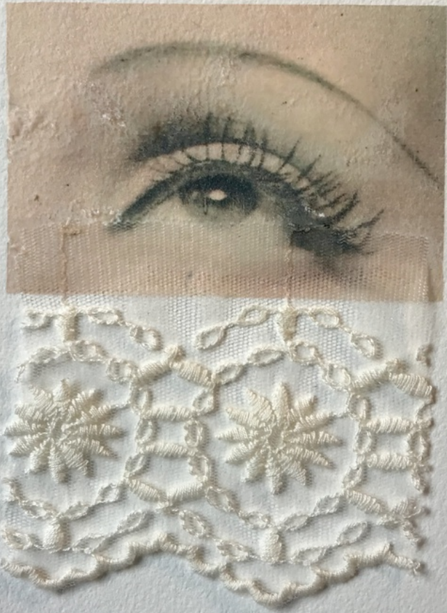
Constance Boulay, Mes inconnues , 2022, photo transfert sur Arches, incrustation de dentelle, 21 x 29,7 cm