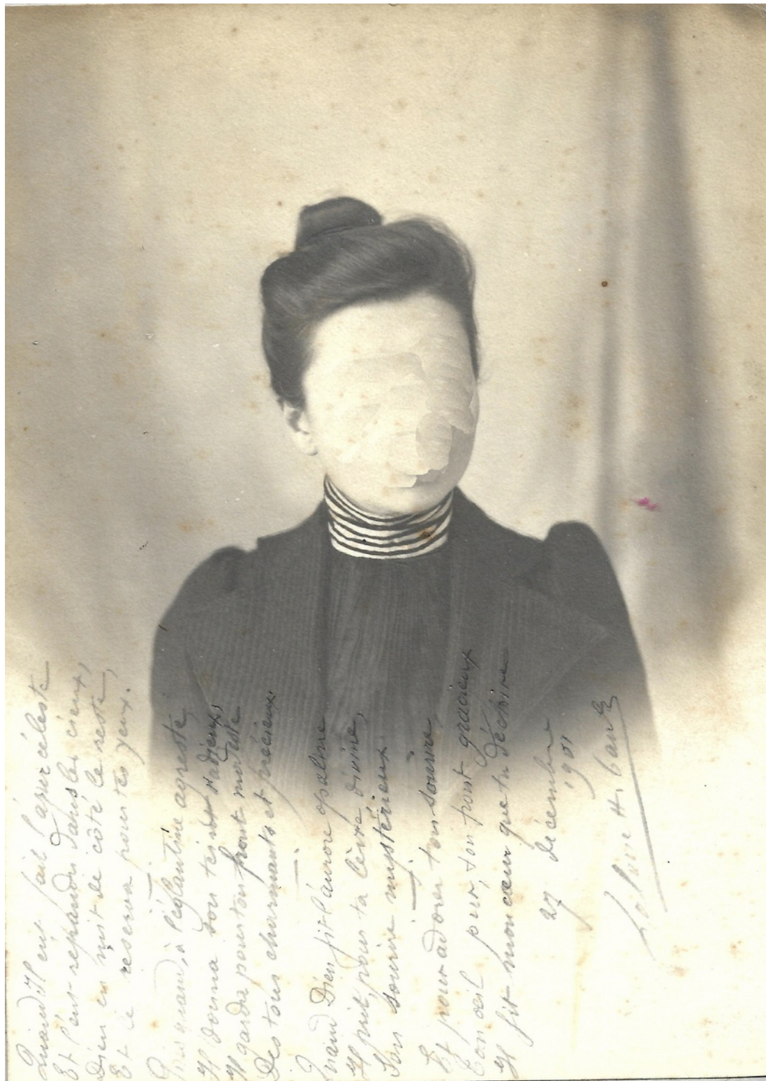
Constance Boulay, Mes inconnues , 2021, photo transfert sur drap, retouche numérique, 140 x 100 cm

Quand il est fait l'apex céleste Et l'on regarde l'absolu créant, Qu'en est-il de côté le reste, Et le recevoir pour tes yeux.