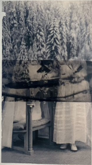
Constance Boulay, Fantômes , 2023, photo transfert appliqué sur photo transfert sur papier Arches, 21 x 24 cm