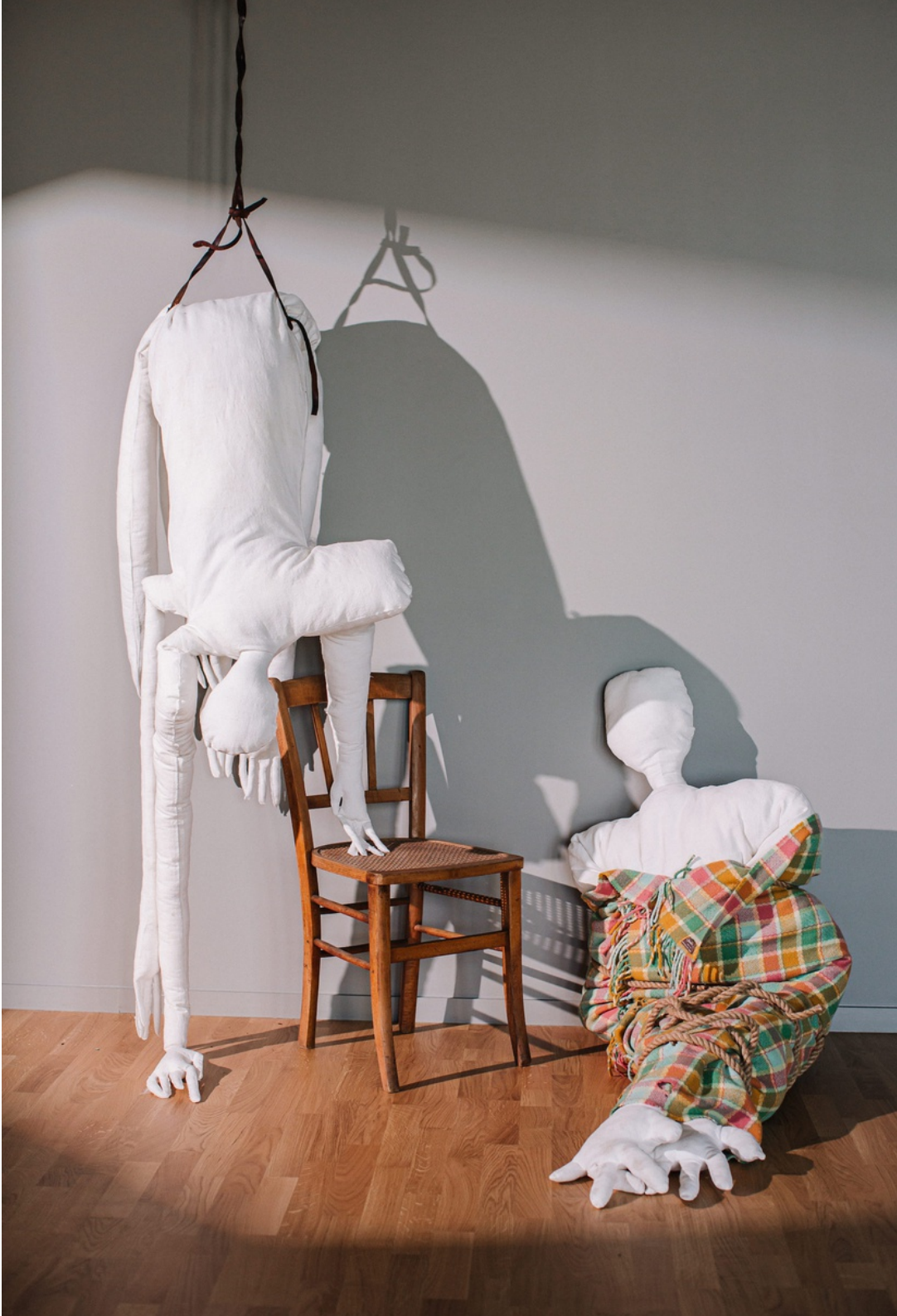
Constance Boulay, vue d'installation, Mes grosses mères , 2022, drap de lin, chaise cannée, couverture en laine, cuir, couture, ouate, corde de jute, 250 x 250 x 130 cm