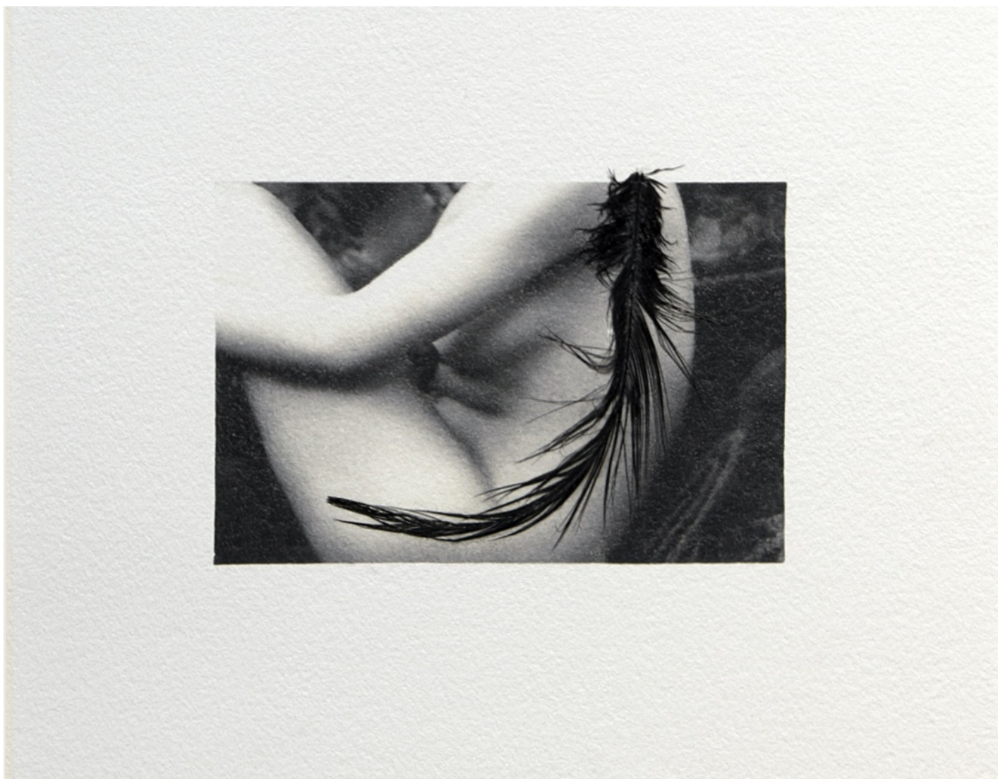
Constance Boulay, Ne te courbes pas le dimanche , 2022, transfert photo sur papier Arches, incrustation d'une plume, 31 x 29 cm