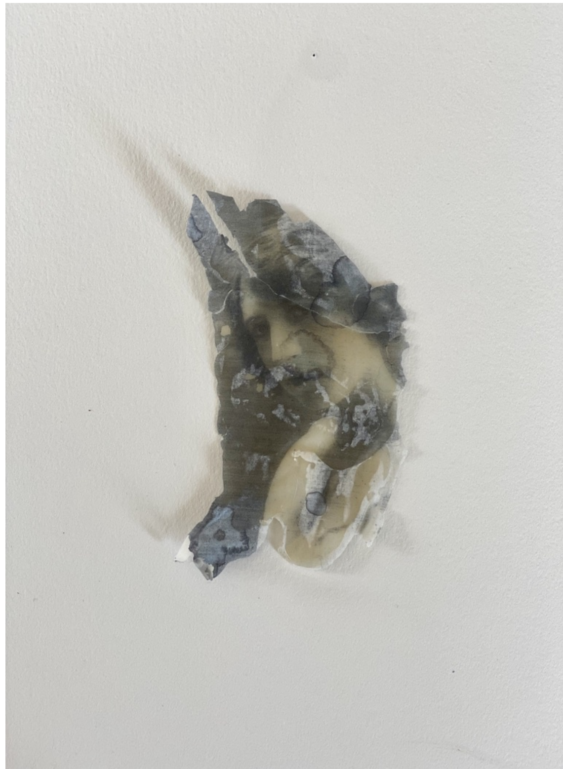
Constance Boulay, Peaux de photographie , 2023, Photo transfert sur cire d'abeille, 8 x 6 cm