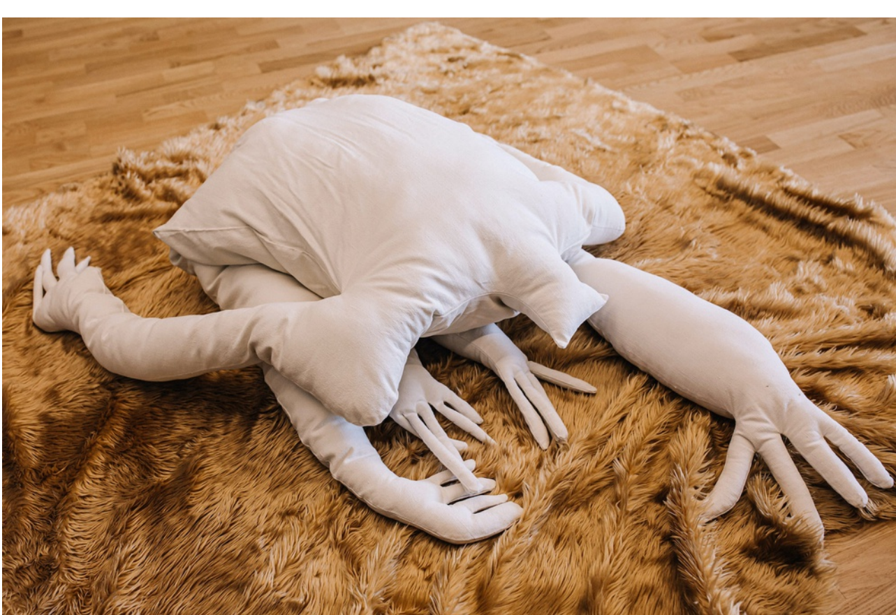
Constance Boulay, Tu ne ploierais pas , avec détail à droite, 2022, draps de lin, couture, ouate, 210 x 120 x 85 cm