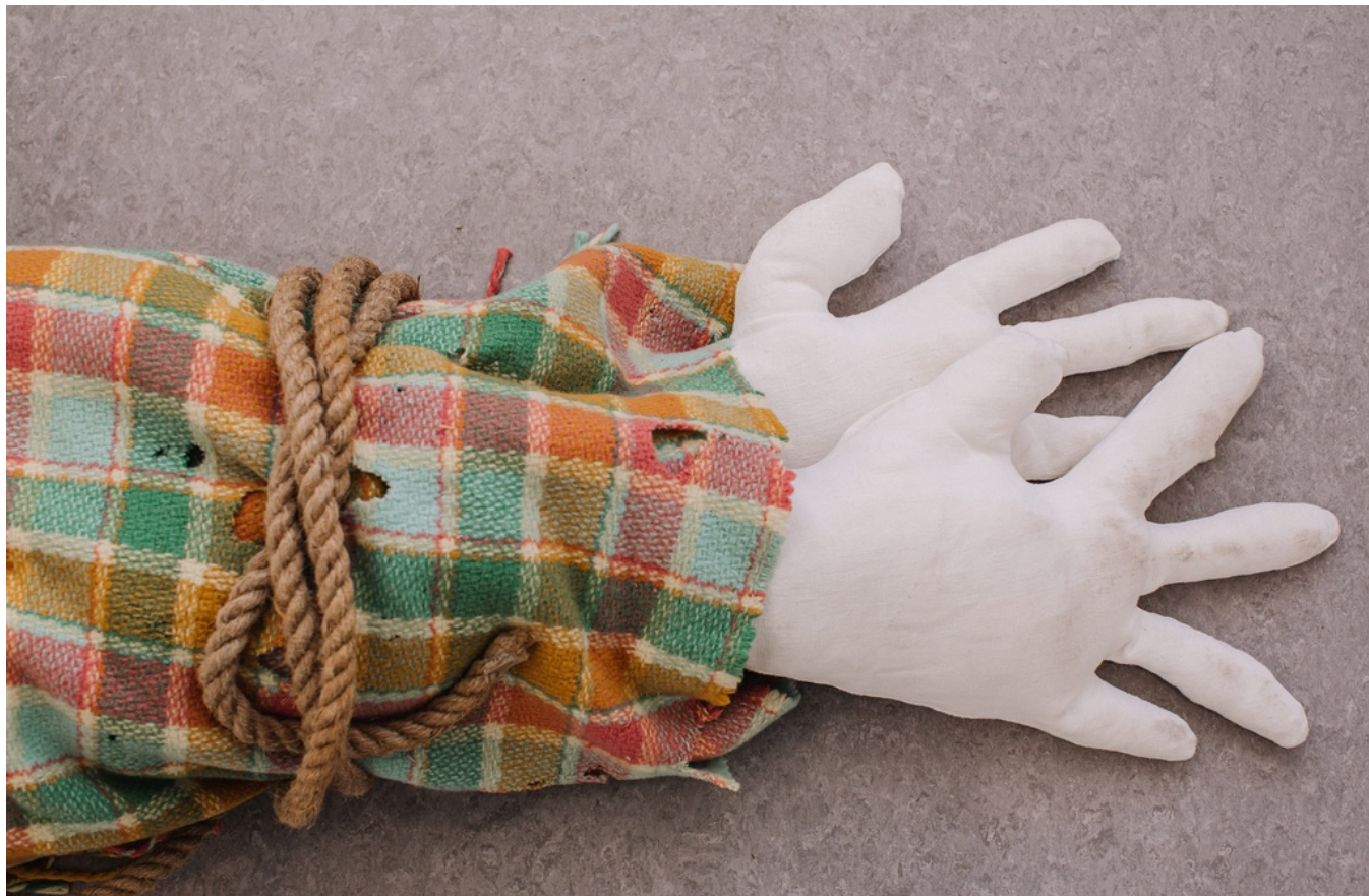
Constance Boulay, Ma cage , détail, 2021, plaid en laine, corde, ouate, couture , 210 x 90 x 70 cm