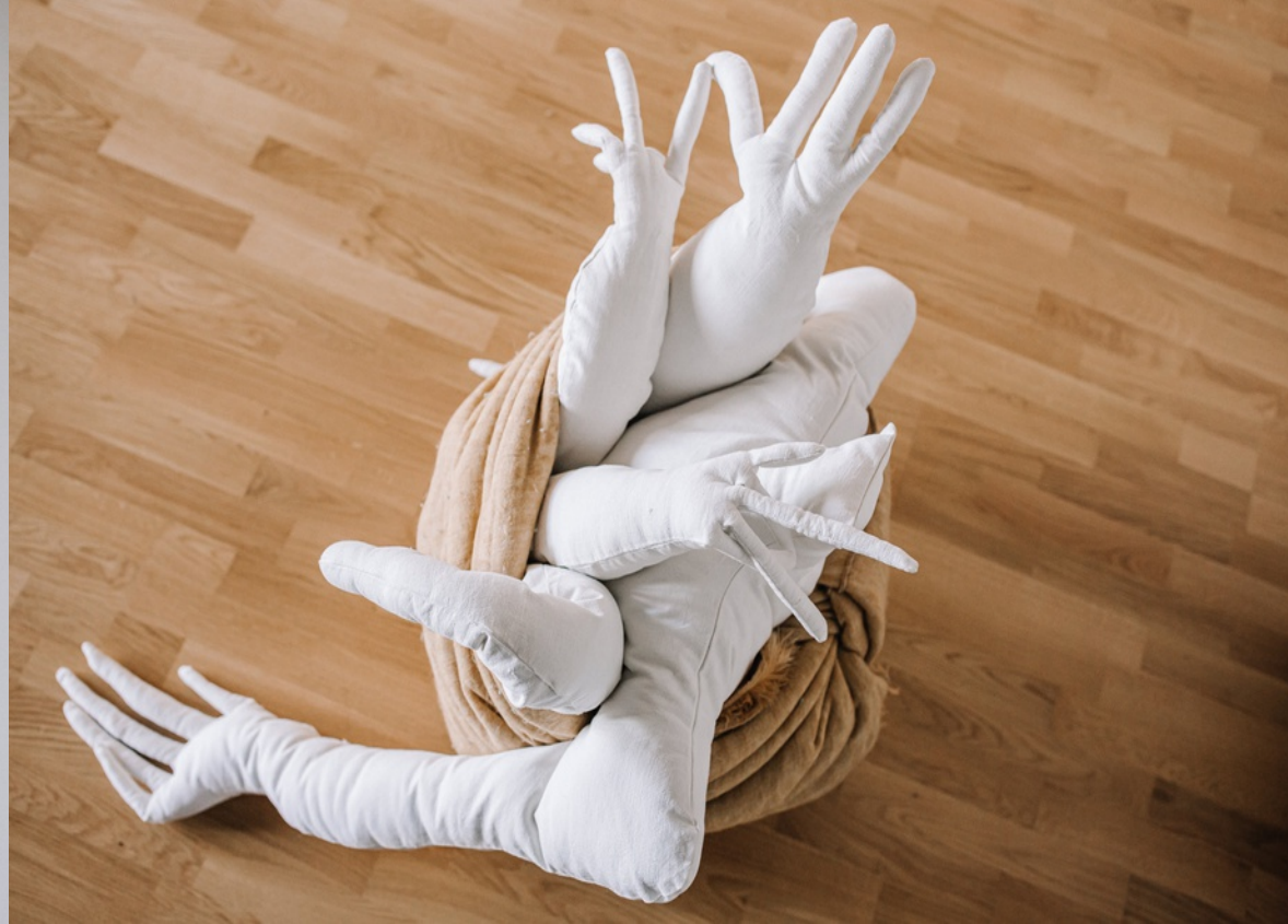
Constance Boulay, Jeune pousse , avec autre vue à droite, 2022, plaid draps, couture, ouate 140 x 120 x 70 cm