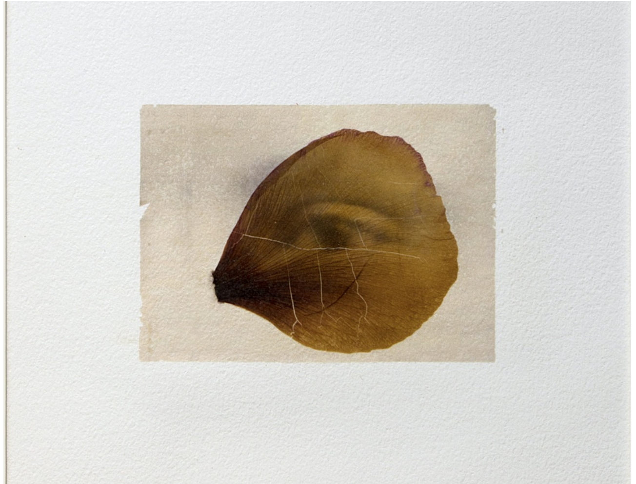
Constance Boulay, Série Mutation végétale , 2022 transfert photographique sur papier Arches, incrustation d'un pétale, 36 x 32 cm