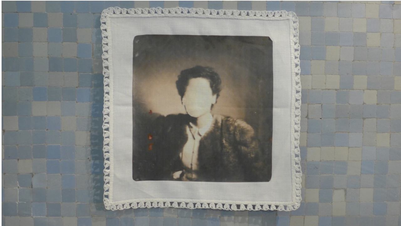
Constance Boulay vue d'exposition, série mes inconnues , 2021, photo transfert sur mouchoir, 26 x 26 cm