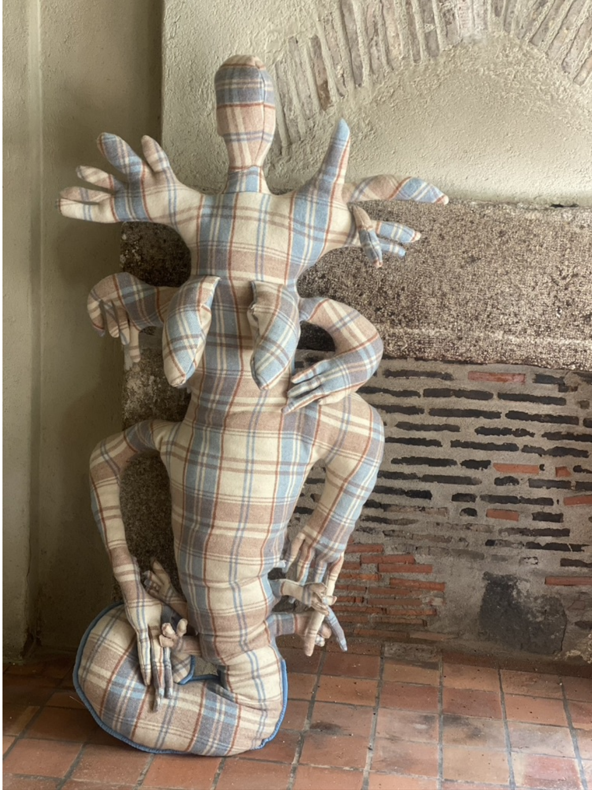
Constance Boulay, Bernarde l'hermite 2023, plaid, couture, ouate, 180 x 90 x 60 cm