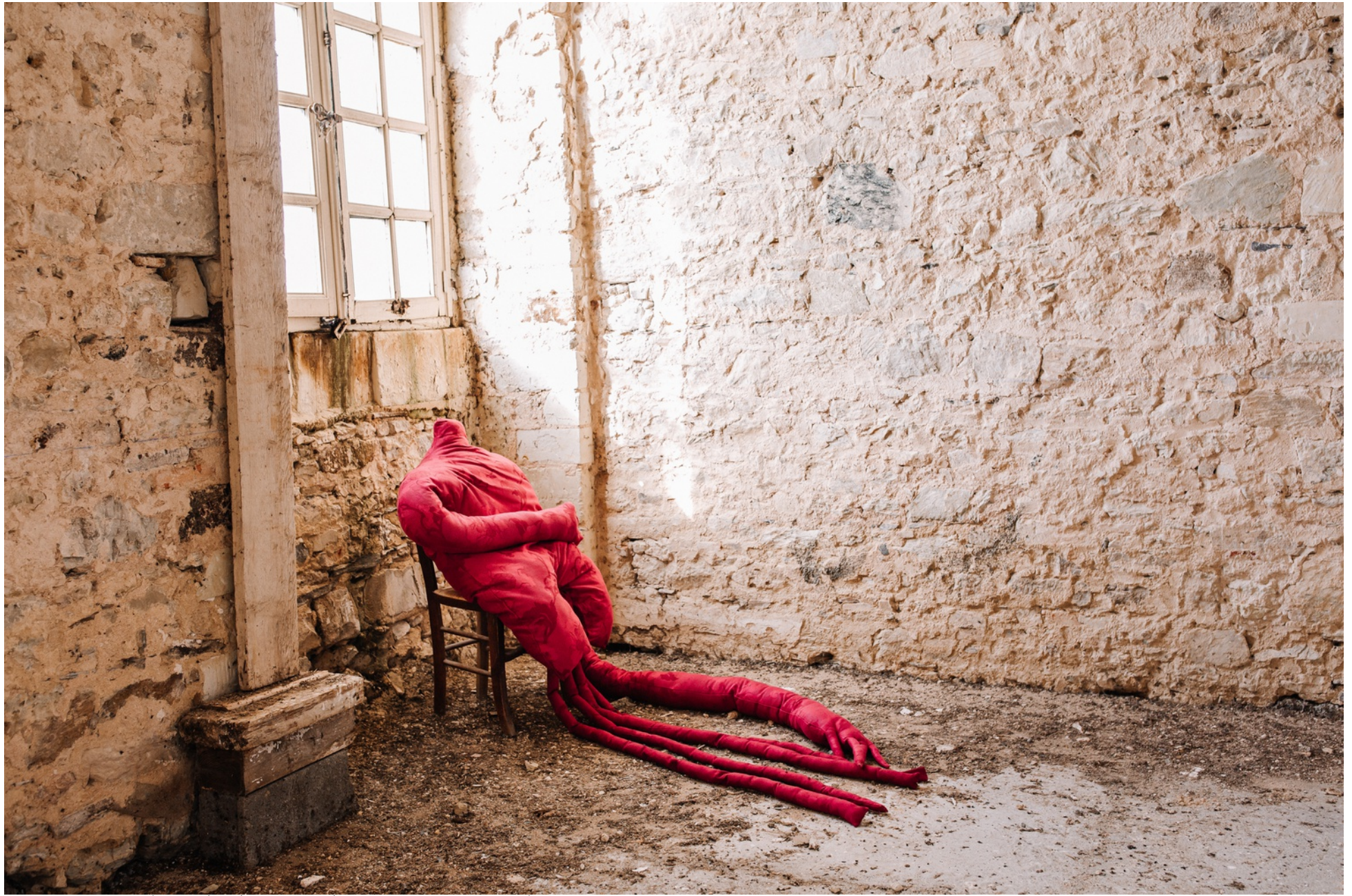
Constance Boulay, Charlotte, une histoire vraie , 2023, draps, couture, ouate, 240 x 120 x 80 cm