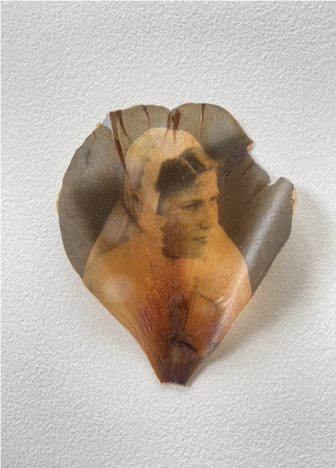
Constance Boulay, Les radieuses , 2023, phototransfert sur pétale, 6 x 4 cm