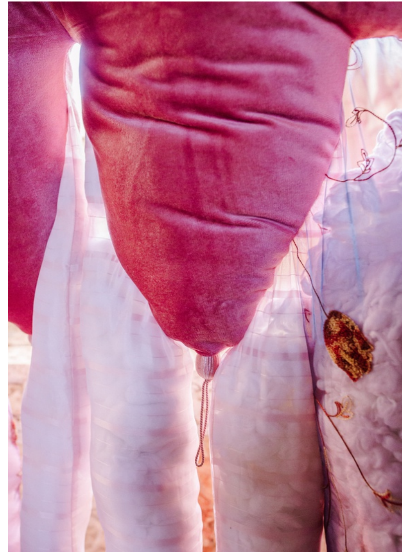
Constance Boulay, La poulpe , avec détail à droite, 2022, rideaux velours, mousseline, couture, ouate, passementerie, broderie, 190 x 120 x 60 cm