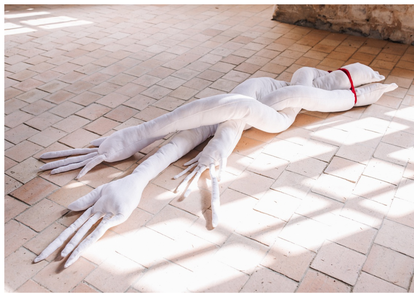
Constance Boulay, Prendre racine , avec détail à droite, 2023, draps de lin, couture, broderie, velours, 270 x 100 x 60 cm