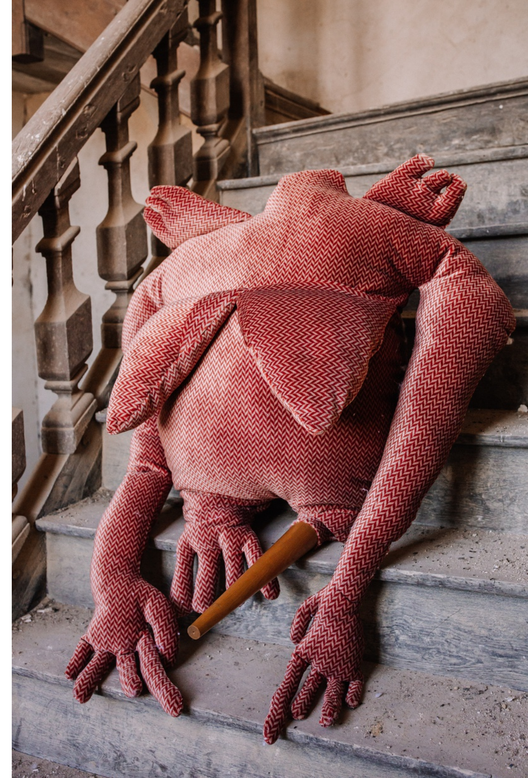
Constance Boulay, Cocotte , 2023, rideaux en velours de panne, couture, pied de table en bois, 210 x 170 x 100 cm