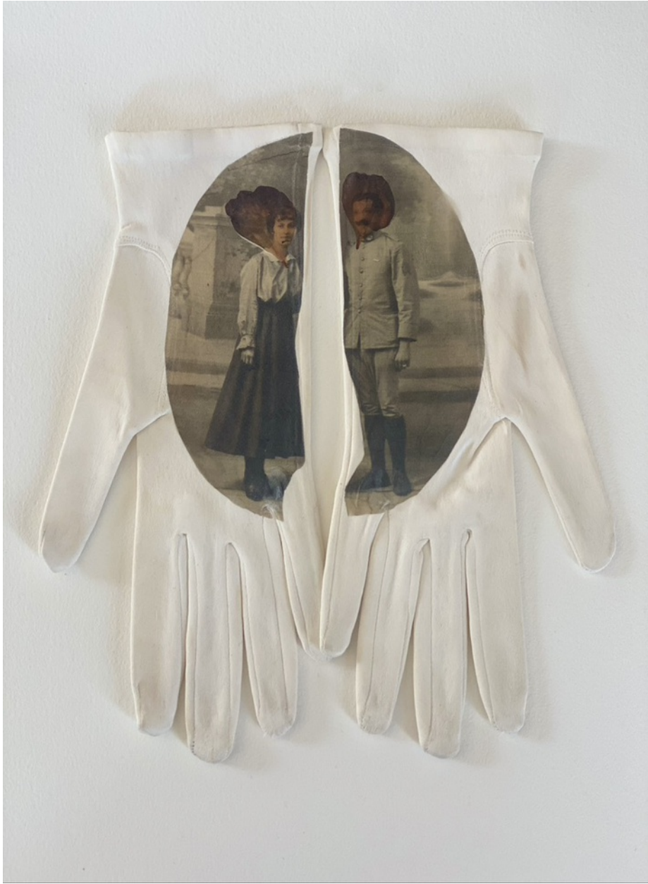
Constance Boulay, Les inséparables , 2023, photo transfert sur gant et incrustation de pétale, 18 x 14 cm