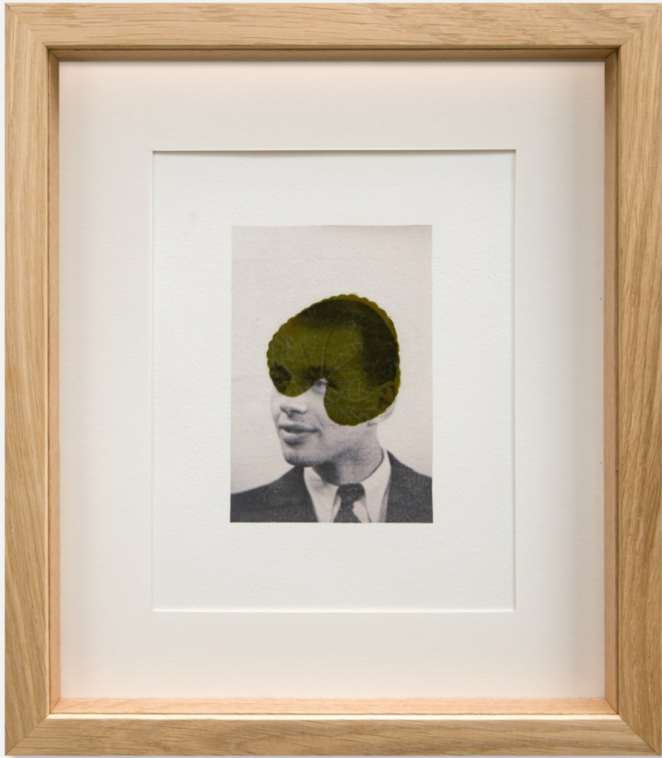
Constance Boulay, Mutation végétale , 2022, transfert photographique sur papier Arches, incrustation d'une feuille en cire, 36 x 32 cm